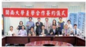
▲開南大學與桃市旅行商業同業公會簽訂產學合作